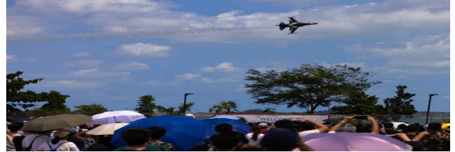
[그림 2] Singapore Airshow 2024

무대에 처음으로 공개하였다. 또한 싱가포르 항공(Singapore Airlines), 대한항공, 카타르항공, ANA, 에어버스 등이 참석해 신기종 도입 및 협력 계약을 체결하였다. Airbus는 A350F 화물기 계약을, Boeing은 737 MAX 주문 확정 등의 성과를 발표하였다.